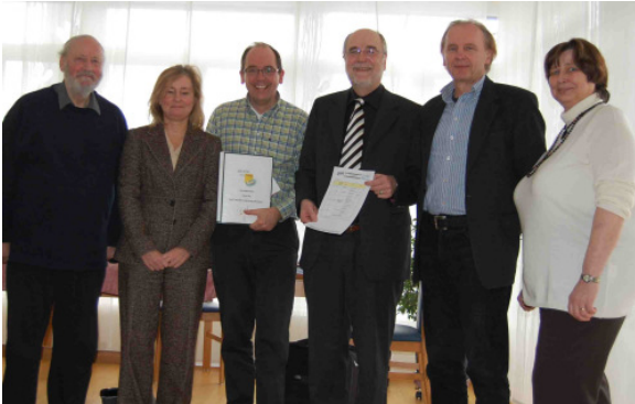
Das DVWO Gutachter-Team am 12.2.10 zu Gast bei STUFEN